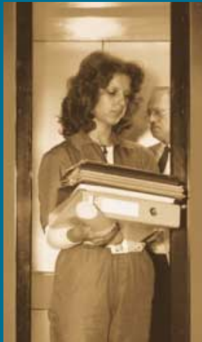
Vor dem UpLift von OTIS.