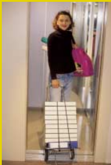
UpLift gewährleistet eine dauerhaft präzise Bündelstellung.