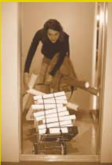
Schlechte Bündelstellung erschwert das Ein- und Aussteigen.

UpLift reduziert ein Unfallrisiko oder die Möglichkeit von Funktionsstörungen auf ein Minimum. Das bedeutet maximale Sicherheit für Fahrgäste, Aufzugswärter/Hausmeister, Wartungspersonal und TÜV-Ingenieure.