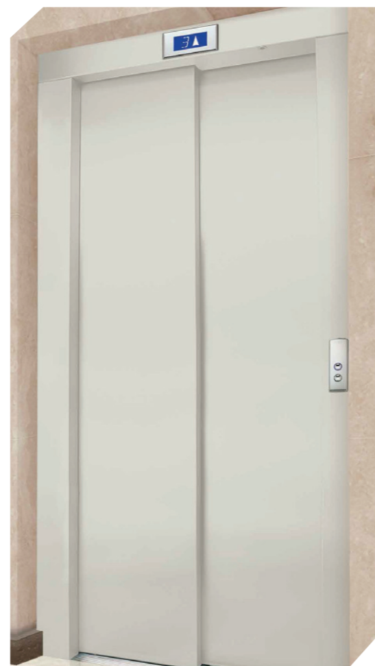
Aço carbono pré-pintado