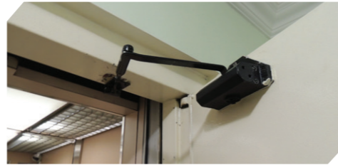
A tecnologia da Porta Inova elimina a instalação de amortecedores.

A tecnologia da Porta Inova elimina a instalação dos amortecedores de porta, que é um dos itens substituídos com maior frequência devido a sua grande utilização e desgastes frequentes e que exigem investimentos constantes por parte do condomínio.