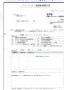
エレベーター遠隔監視報告書 (月 1 回報告)

OTISLINE ※ は遠隔監視システム (REM) からの自動通報を、24 時間体制で監視しています。万が一の災害時やトラブル発生に備えます。