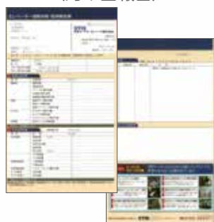
エレベーター遠隔点検監視報告書 (月 1 回報告)