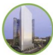
Torre Granite, Parigi