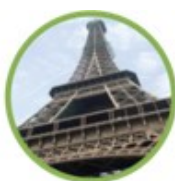
Torre Eiffel, Parigi