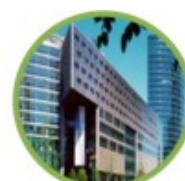
Sony Center, Berlino

https://www.otis.com/corporate/our-company/