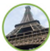
Torre Eiffel, Parigi