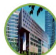
Sony Center, Berlino

https://www.otis.com/corporate/our-company/