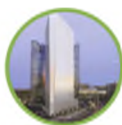
Torre Granite, Parigi