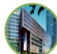
Sony Center, Berlino

https://www.otis.com/corporate/our-company/