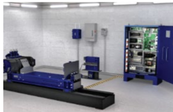
SOLUTION ACTUELLE À CÂBLES