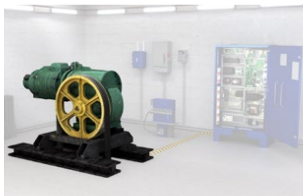
NUVÆRENDE LØSNING MED REB